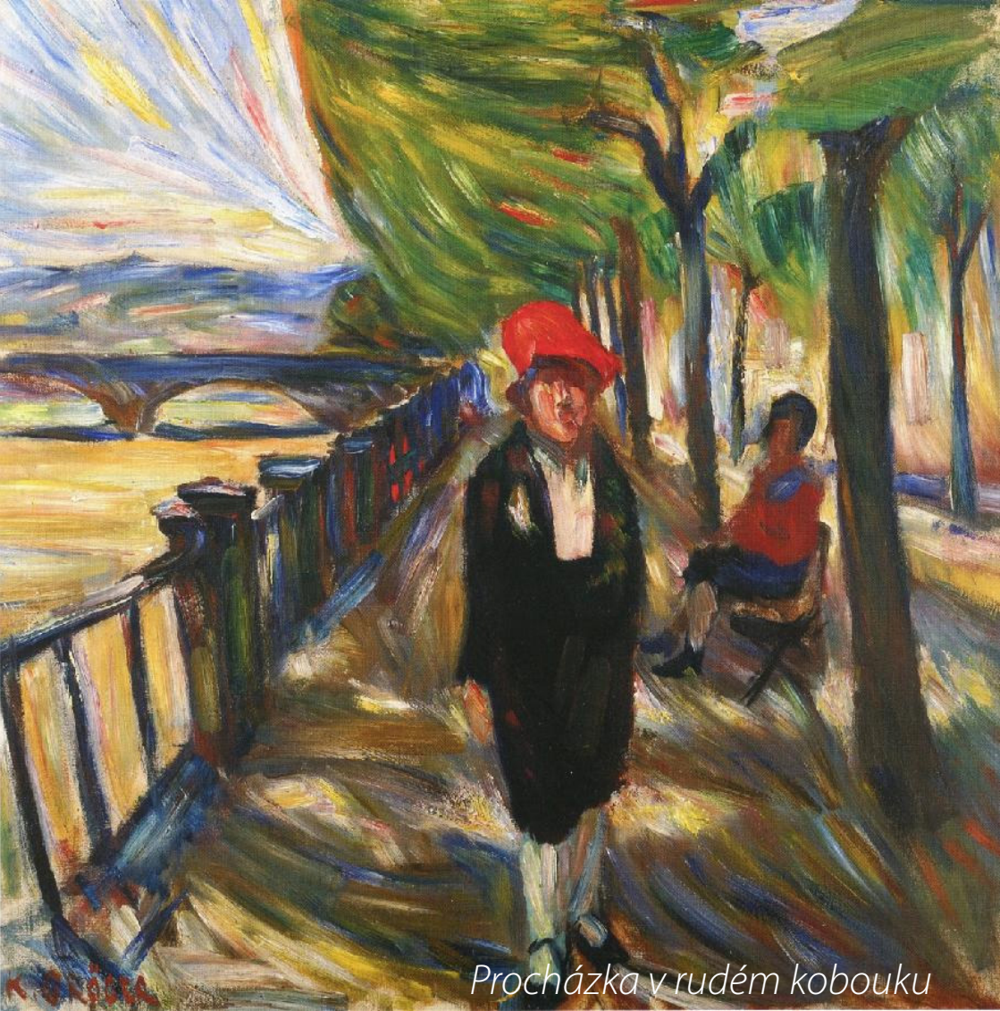
Procházka v rudém kobouku